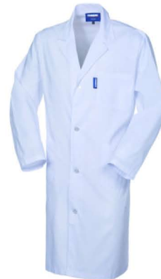
02 – BIANCO