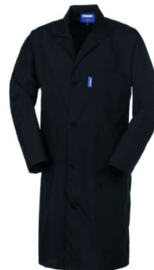
05 – NERO