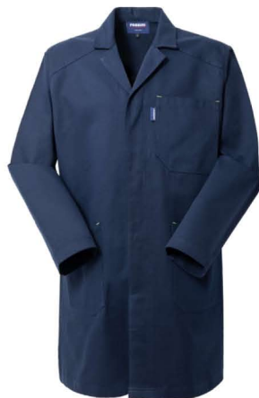
01 – BLU