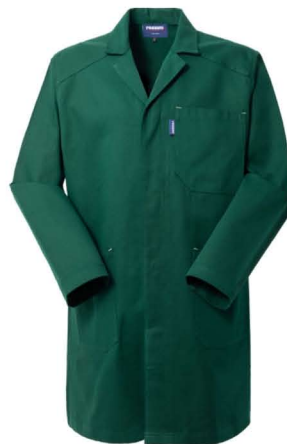
04 – VERDE