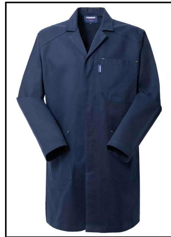
01 – BLU