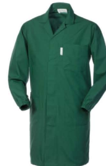
04 – VERDE