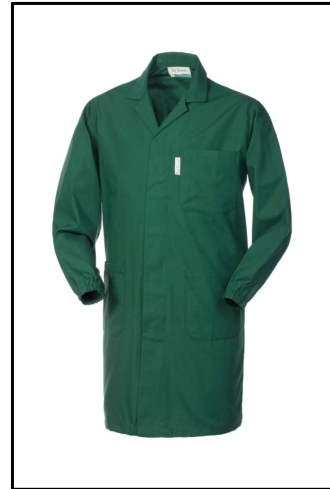
04 – VERDE