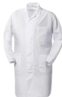
02 – BIANCO