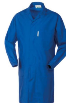
06 – AZZURRO ROYAL