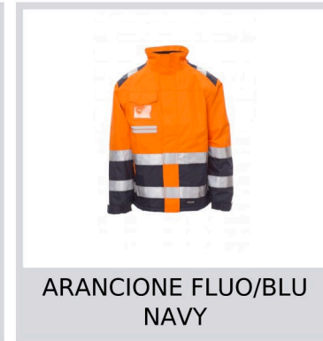
ARANCIONE FLUO/BLU NAVY