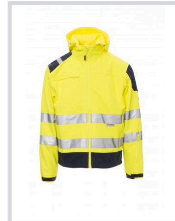
GIALLO FLUO/BLU NAVY