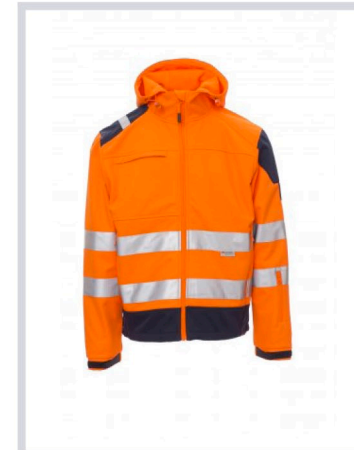
ARANCIONE FLUO/BLU NAVY