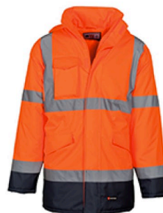
ARANCIONE FLUO/BLU NAVY