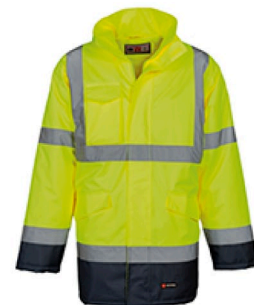
GIALLO FLUO/BLU NAVY