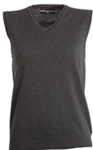
GRIGIO CENERE MELANGE