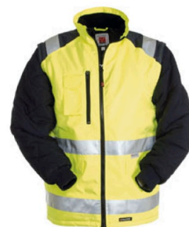
GIALLO FLUO/BLU NAVY