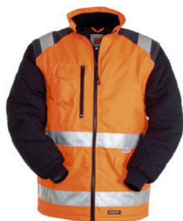
ARANCIONE FLUO/BLU NAVY