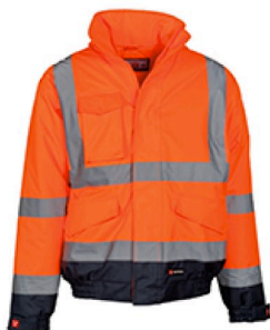
ARANCIONE FLUO/BLU NAVY