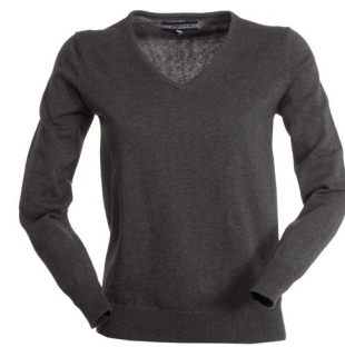
GRIGIO CENERE MELANGE