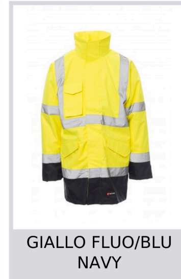
GIALLO FLUO/BLU NAVY