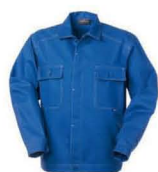
06 azzurro royal