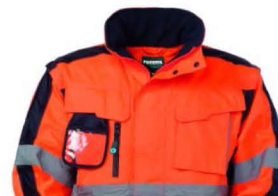
21 – ARANCIO/BLU