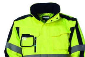
42 – GIALLO/BLU