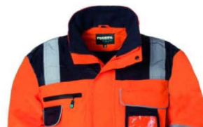
21 – ARANCIO/BLU