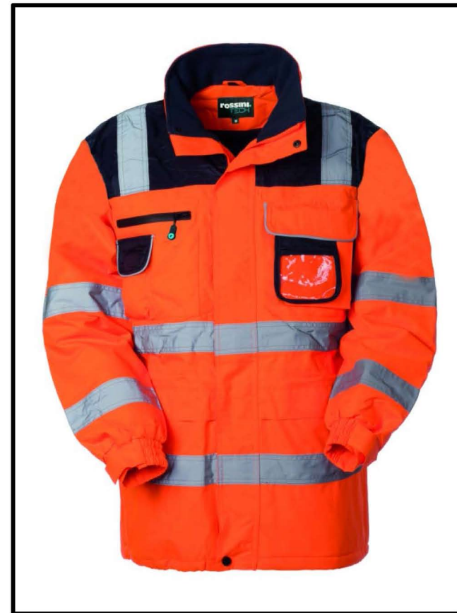
21 – ARANCIO/BLU