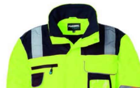
42 – GIALLO/BLU