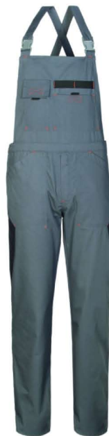
GY – GRIGIO/NERO