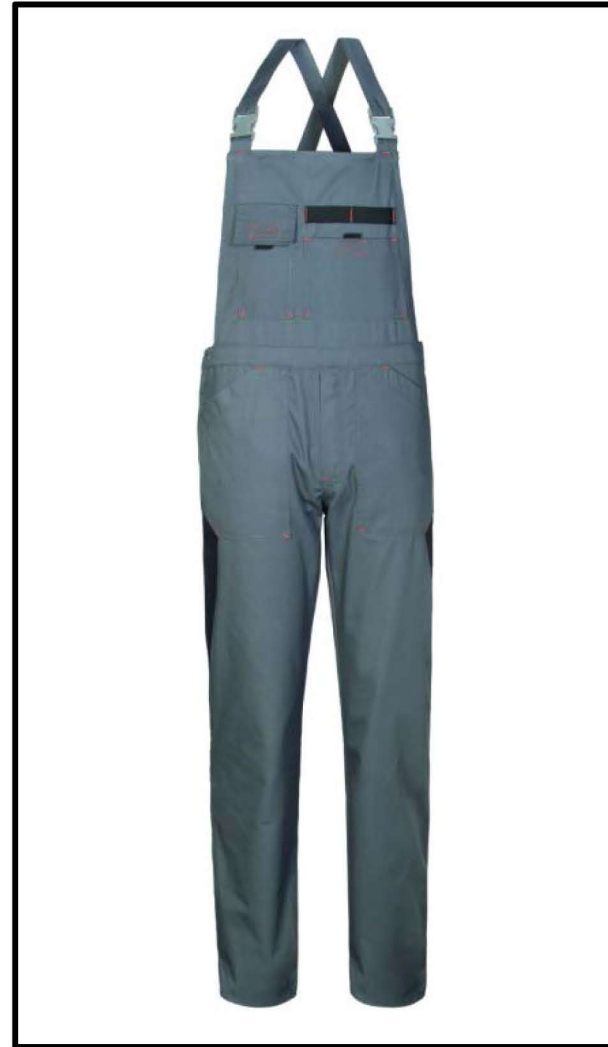
GY – GRIGIO/NERO