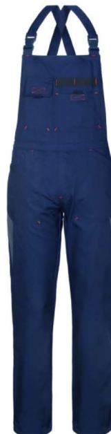
80 – BLU/GRIGIO