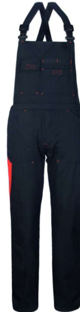
64 – NERO/ARANCIO